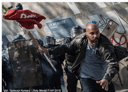
Złoty Medal FIAP 2016

X INTERNATIONAL SALON OF PHOTOGRAPHY TYLKO JEDNO ZDJĘCIE 2017 JUST ONE PHOTO