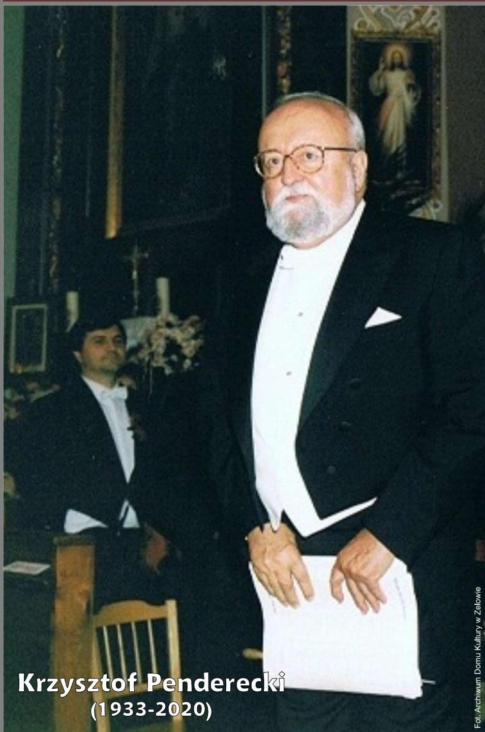
Krzysztof Penderecki (1933-2020)