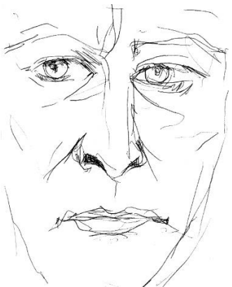
Rys. Barbara Medajska